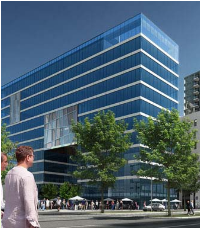
”Solfanger`n” - også kalt PwC-bygget