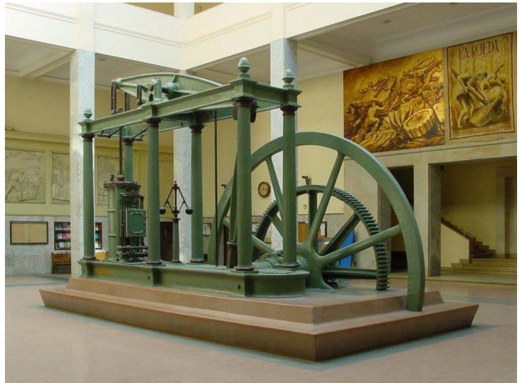
Watt`s dampmaskin - i gammel versjon