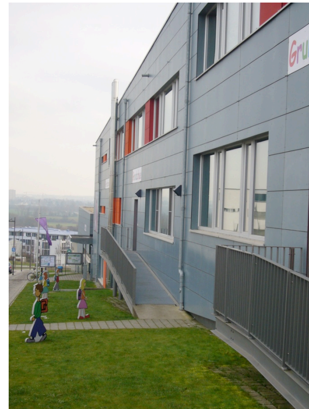
Passivhus skole i Frankfurt